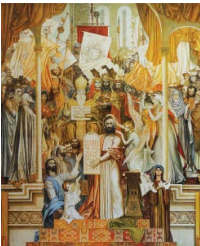
«Հայոց այբուբենը» (գրել է Ն. Գրիգոր Խանջյան, 1981 թ., Մայր աթոռ Սբ Էջմիածին)

Նորոյա Շաղախի Սուրբ Գեորգ եկեղեցու վերածման օրը՝ 2014թ. օգոստոսի 28-ին, անկարելի էր չհիշել Շաղախի պատմության վերոնշյալ եւ բազում այլ դրվագներ, դարերի հեռավորությունից հարգանք չընծայել Սյունյաց աշխարհի հոգեւոր եւ աշխարհիկ մեծերին, ովքեր ժամանակին մեր երկրամասի հնագույն