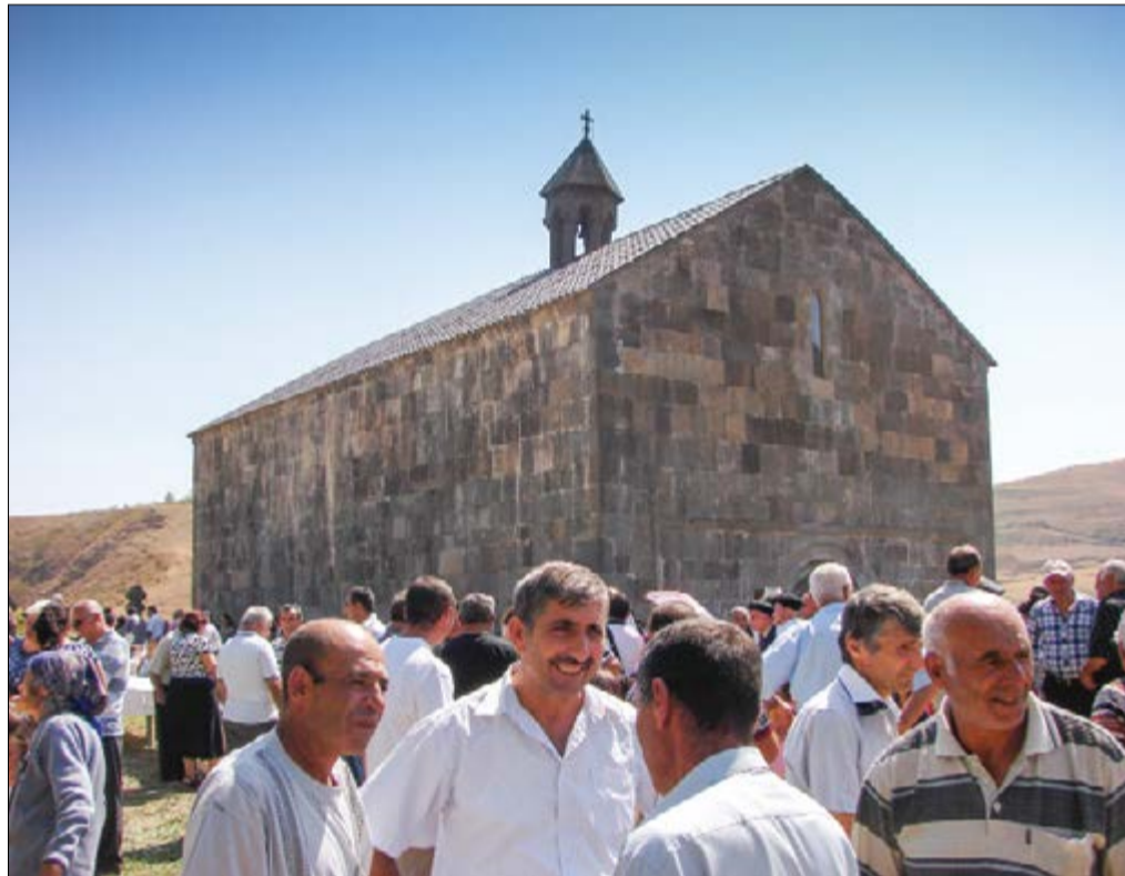
2014թ. օգոստոսի 28-ը. վերածված Սուրբ Գեորգ եկեղեցին

2014թ. օգոստոսի 28-ը, հիրավի, շաղապեցու համար դարձավ պատմական՝ եւ որպես Սուրբ Գեորգ եկեղեցու վերածննդի օր, եւ որպես Շաղապ համայնքի օր: Ինչպես ասում են, հարուստ է ոչ թե նա, ով կարողություն ունի, այլ նա, ով նվիրաբերում